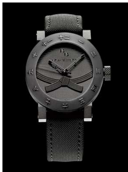
Les montres Black Belt sont exclusivement réservées aux porteurs de ceintures noires

A quelques mois d'écart, c'est pourtant le même Yvan Arpa que l'on retrouve dans l'un puis l'autre endroit, même sourire, même enthousiasme, même petite touche de folie dont on ne sait jamais très bien jusqu'où il la contrôlera. En mars, il présentait les nouveautés de Romain Jérôme dont il était l'âme ; en cette fin octobre, il accompagne la première sortie officielle de son nouveau bébé, la Black Belt Watch, une montre réservée exclusivement aux ceintures noires, et que « l'argent seul ne peut pas acheter », proclame-t-il dans un micro.